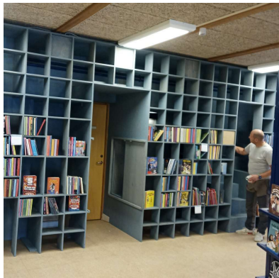
Redskabsbillede > Del 1 redskab