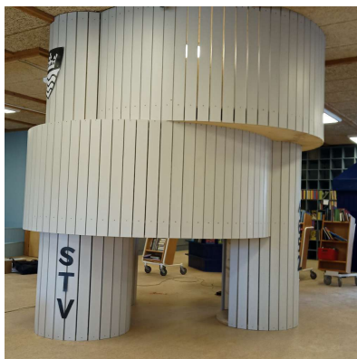
Redskabsbillede > Del 1 redskab